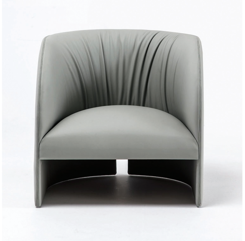
1663 QI / 1663T QI