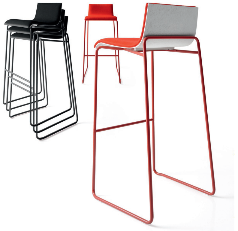
2574 BW - 2590 BW

Sgabello impilabile con struttura in metallo cromato, scocca in faggio o rovere (naturale, tinto o laccato opaco) completamente a vista.